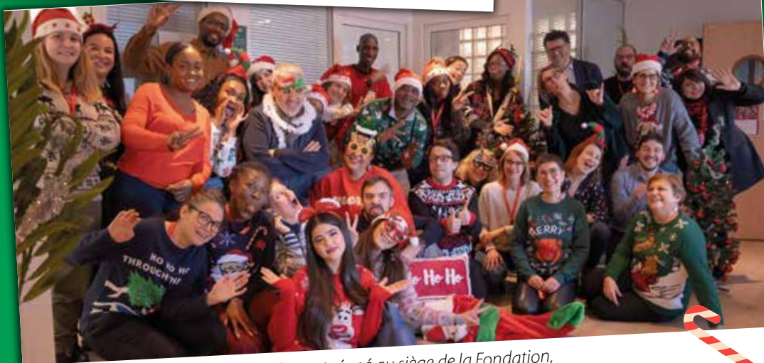
L'esprit de Noël a également régné au siège de la Fondation, des sourires et des grimaces pour une photo joyeuse avec des pulls tout en couleur.