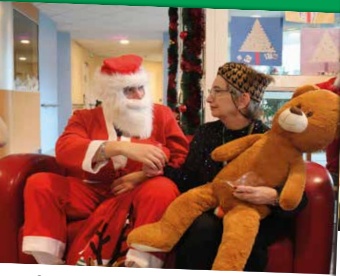
Conversation avec le Père Noël à la MAS Les Murets.