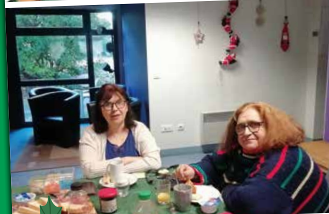
Petit-déjeuner festif de fin d'année de la Résidence Accueil de Chevilly-Larue.