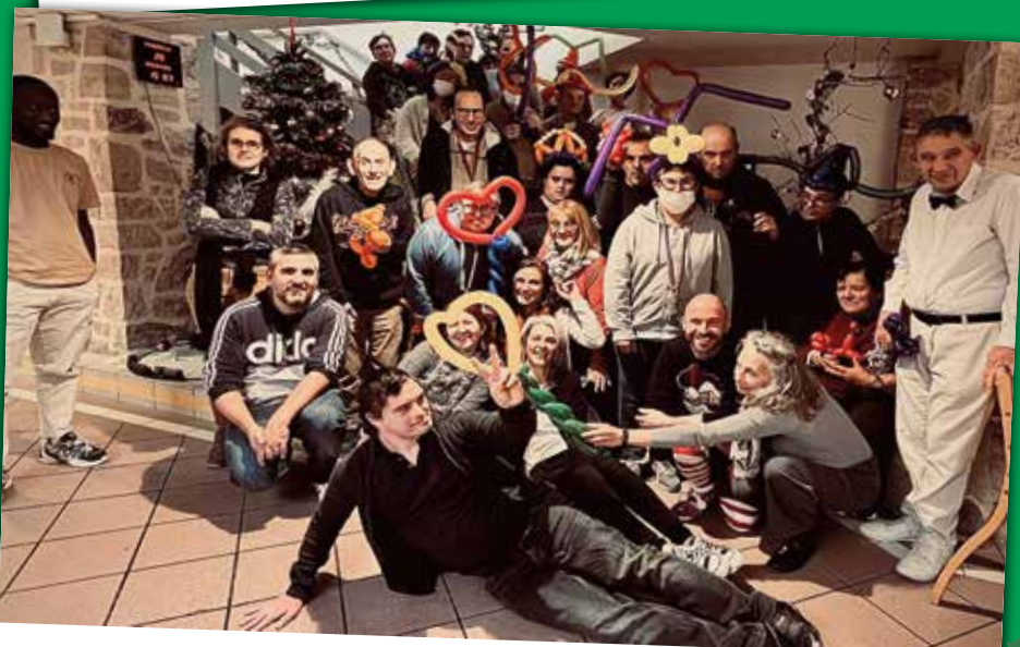
Magie de Noël, musique, boissons chaudes, pâtisseries locales et bonne humeur en présence des familles à l'EAM le Jardin des Amis.