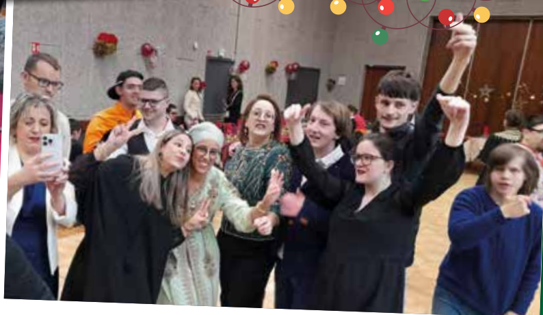
Des tables fleuries et de la joie pour une fête orientale en cette fin d'année au Foyer de Villemer !