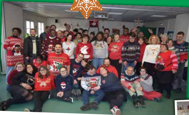
Que de beaux pulls de Noël au CAJ Les Robinsons !