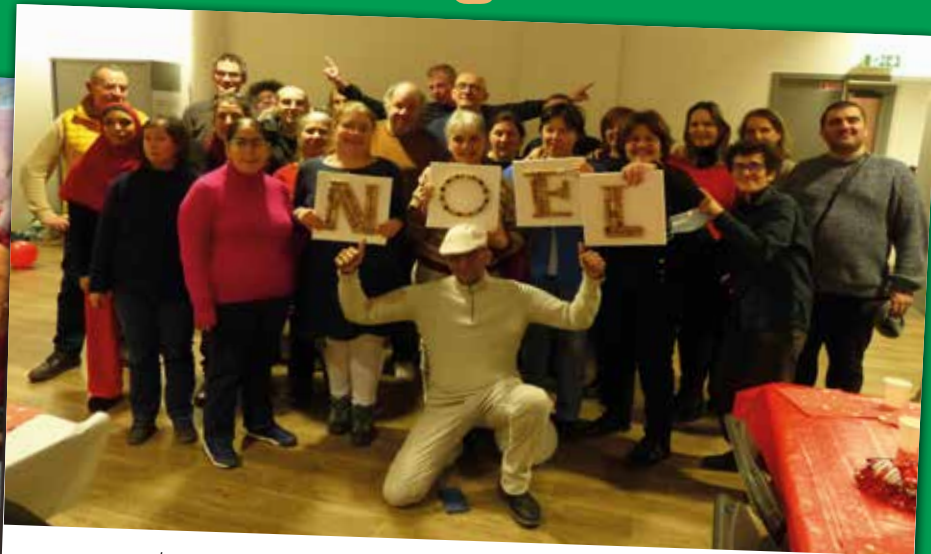
Les personnes accompagnées du SAVS ainsi que les résidents de la Maison Relais ont fêté Noël à la Maison des Associations de Clamart.