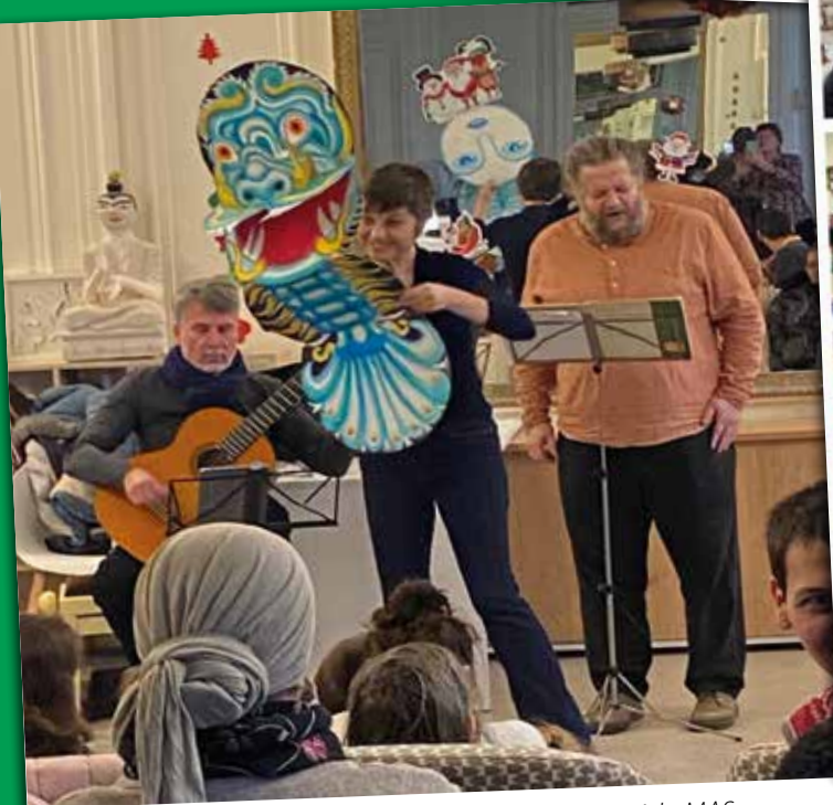
Spectacle de la Compagnie la Grande Fugue à la MAS Les Deux Marronniers pour les enfants des salariés du Pôle Parisien.