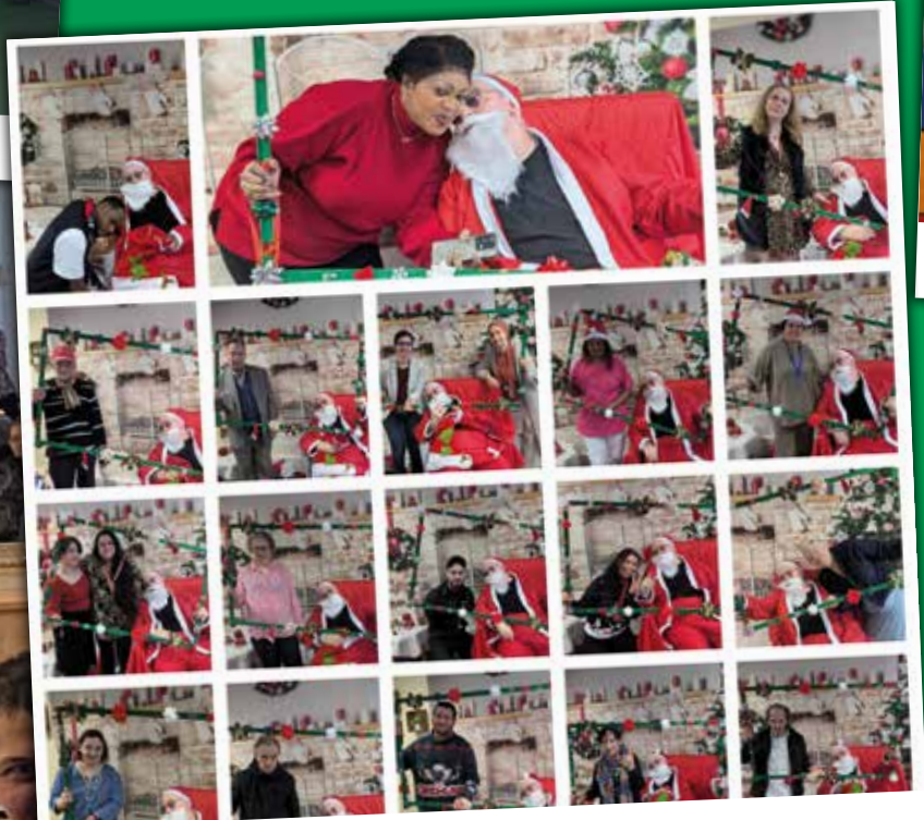
Cette année, les résidents et les professionnels du FAM Sylvae ont organisé une merveilleuse fête de Noël remplie de joie, de rires et de chaleur humaine !